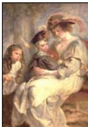
Hélène Fourment et ses enfants, 1636

9. Il n'aime plus peindre qu'une seule chose ou plutôt une seule personne : Hélène. Les dernières années de sa vie -il meurt en 1640- sont ainsi occupées à peindre les portraits d'Hélène dans son jardin, avec ses enfants, dans un carrosse, images de la joie familiale et du bonheur de vivre que la touche vibrante et colorée de Rubens exprime à la perfection.