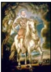
Le duc de Lerma

5. En 1600, Rubens part en Italie où il découvre avec passion les grands maîtres italiens de la peinture. Il est fasciné et copie leurs œuvres avec talent. Rubens