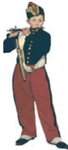
Le Fifre, 1866

10. Malheureusement, en 1881, Manet attrape une terrible maladie des poumons qui le fait beaucoup souffrir. Lui qui aime tellement les fêtes de la vie parisienne est souvent obligé de rester chez lui, dans son lit. Il a cependant le courage de peindre un de ses plus grands chef-d'œuvres, Le bar des Folies Bergères , un café très à la mode de l'époque, à Paris. Il meurt en 1883, à l'âge de 51 ans. Le grand écrivain français Emile Zola qui l'avait toujours défendu, parle d'un génie de la peinture qui disparaît. Comme il avait raison !