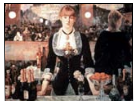
Le bar aux Folies Bergères , 1881-82