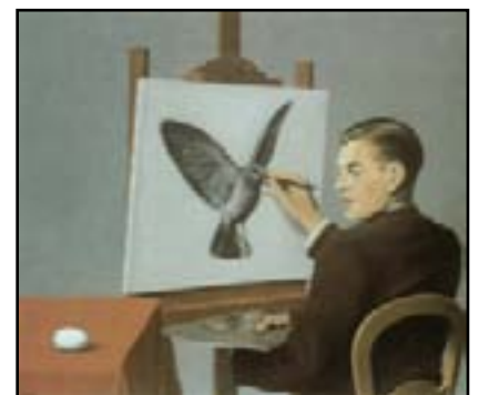
La Clairvoyance, 1936

8. Si tu examines de près les toiles de Magritte, tu remarqueras qu'il emploie toujours des objets très simples et très familiers pour composer ses tableaux : une clé, un verre, un parapluie, un oiseau, un chapeau etc ... Amuse-toi à rêver en entrant dans un tableau de Magritte, c'est un instant d'émerveillement !