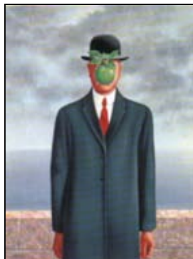
Le fils de l'homme, 1928

6. Par exemple, que veut faire comprendre Magritte, quand il peint une pipe au-dessous de laquelle il écrit : « Ceci n'est pas une pipe » ? Tout simplement que la peinture de la pipe n'est pas une pipe mais une représentation de pipe . On peut penser que Magritte joue avec les mots quand il fait ce genre de peinture mais, comme tous ses amis surréalistes, il aime justement beaucoup jouer avec les mots.