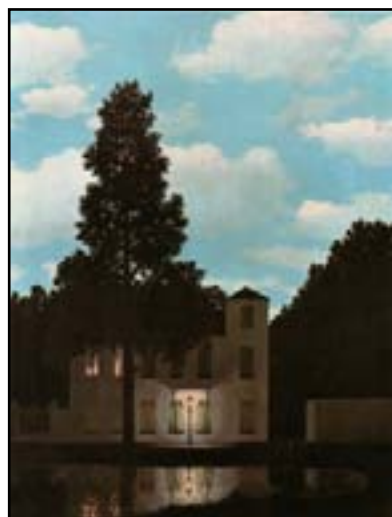
L'Empire des lumières, 1954

2. Magritte est l'artiste du surnaturel. Ses tableaux, toujours peints avec beaucoup de soin, décrivent des situations bizarres comme celle de la maison avec le jour et la nuit simultanés. Avec Dali, il est l'un des peintres surréalistes les plus connus. Mais son style se distingue de celui du peintre catalan à belles moustaches car son origine et surtout sa vision de la peinture sont complètement différentes.