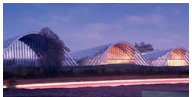
Le centre Paul Klee

10. Le 20 juin 2005, un Centre Paul Klee a ouvert ses portes à Berne. Enfin ! diront les amateurs de l'œuvre de l'artiste. Mais également les amoureux d'architecture. Un lieu magnifique, adapté à l'œuvre d'un artiste puissant et où les enfants sont les bienvenus.